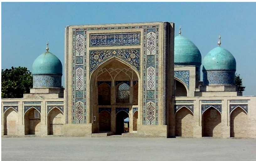
Taškent—medresa (náboženská škola) Barak-Chan

Pro nás to znamená, že v Tádžikistánu funguje pouze jakýsi konzul (může to být i domorodec), který jakýkoliv problém řeší přes