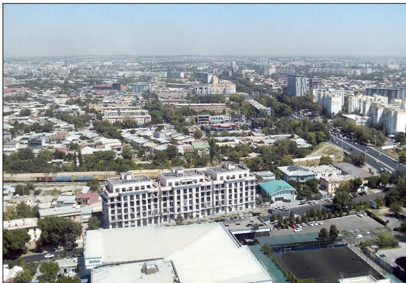
Taškent z televizní věže

dovu. Okolo jsou další vládní budovy a také muzeum Amira Temura. Byl to válečník, politik a reformátor, mecenáš vědy, vzdělání, obchodu, kultury a řemesla. Založil velký centralizovaný stát, posílil jeho moc a také sjednotil mnoho národů a lidí. Vláda Amira Temura podporovala vědu, vzdělání,