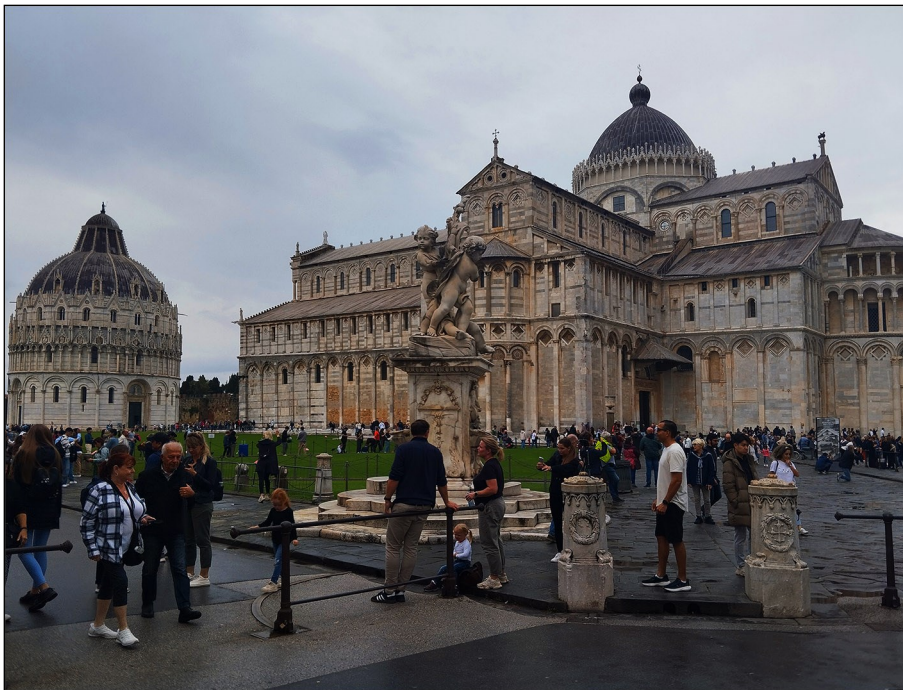
Katedrála v Pise

Z parkoviště jedeme turistickým vláčkem do centra ke katedrále