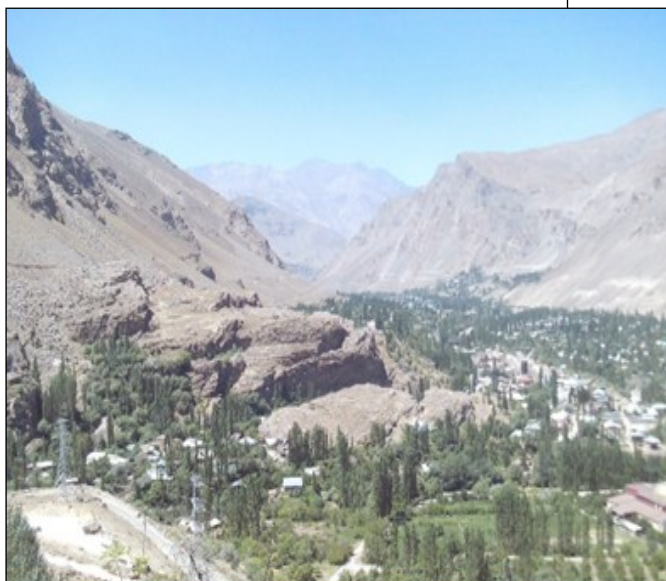
Pamír: Chorug (9. 8.)

existují a žijí v nich lidé. Jsou tu i pastervecké jurty. Z Karakulu je to na hranice k tádžické celnici 52 km, na samotnou