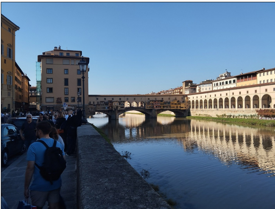
Florence — Ponte Vecchio, „most zlatníků“!