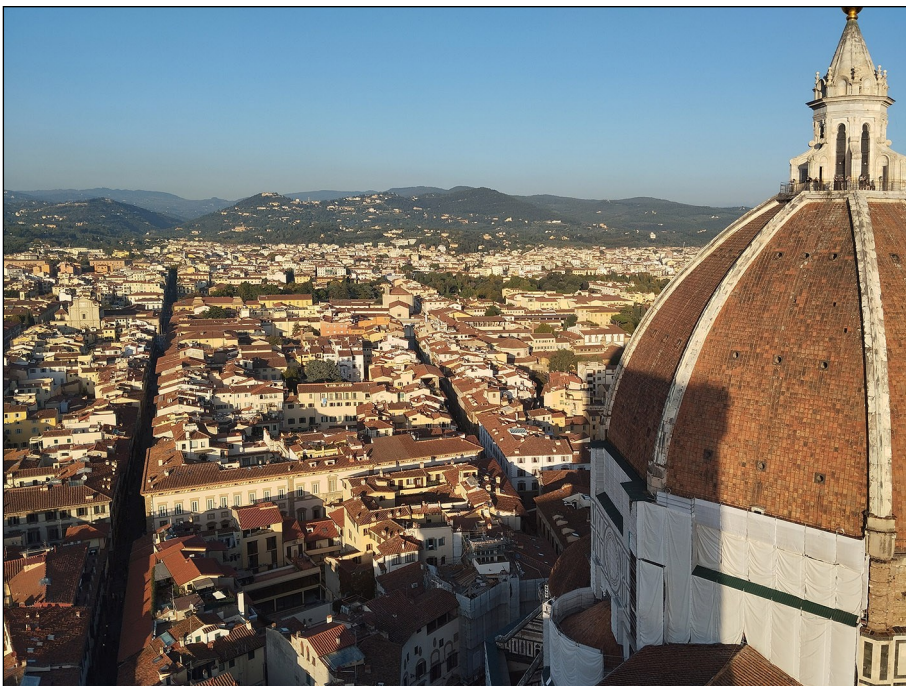
Florence — katedrála (Il Duomo)