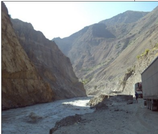
Pamír: hranice Tádžikistán Afghánistán (8. 8.)

mnm), Karakul (129 km / 4100 mnm). Menších vesnic je po cestě méně a méně, ale