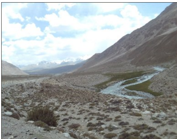
Pamír: cestou do Murgobu (10. 8.)

V Rušonu je jedna z mála odboček. Prašná cesta je těžce sjízdná cesta do velice odlehle a polo uzavřené civilizace v horách, je tu několik roztroušených trvale osídlených vesnic. Cesta se napojuje po