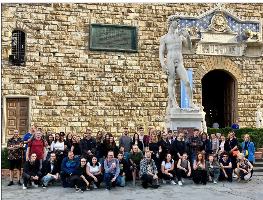
Florence — u baziliky San Lorenzo

Velkovévoda Leopold II. Toskánský ustanovil, že by všechny malířské školy ve Florencii měly být sdruženy pod jednou střechou pod vedením Akademie, a že by měly mít galerii s malbami starých mistrů, které by pomáhaly mladým umělcům ve studiu. Tento úkol plní Akademie s příslušnou galerií i dnes, v bývalém konventu a hospici